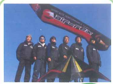
SPORT NITE PERFORMANCE TEAM Air-Reds 2008 World Challenge