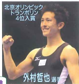
北京オリンピック トランポリン 4位入賞